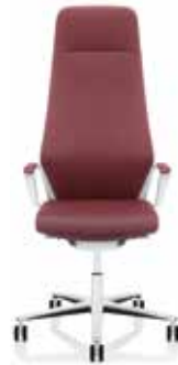
Hohe Rückenlehne mit Kopfstütze High backrest with neckrest Dossier haut avec appuie-nuque