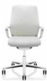
Mittelhohe Rückenlehne Medium-high backrest Dossier de hauteur moyenne