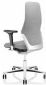
Multifunktionsarmlehne Multifunctional armrests Accoudoirs multifonctions