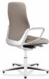
Ringarmlehne Ring armrests Accoudoirs fermés

Choose armrests / Choisissez l'accoudoirs