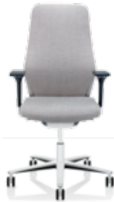
Hohe Rückenlehne High backrest Dossier haut